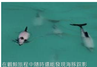
在觀鯨旅程中隨時還能發現海豚踪影

※ 套票以淡季價格計算，於旺季、假期前夕或大型節日期間出發，需另付附加費，詳情向本社職員查詢作準。