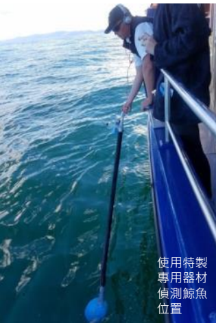
使用特製專用器材偵測鯨魚位置