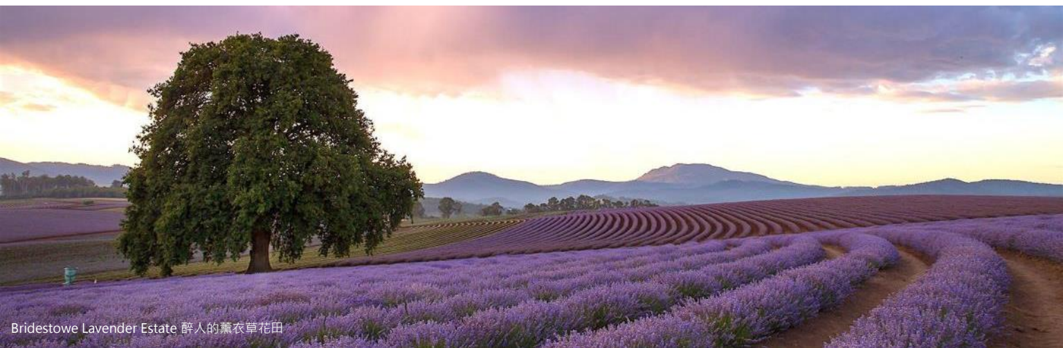
Bridestowe Lavender Estate 醉人的薰衣草花田

7日5夜 [出發日期: 至2020年4月30日] | 7 Days 5 Nights [Travel Period: Till 30Apr20]