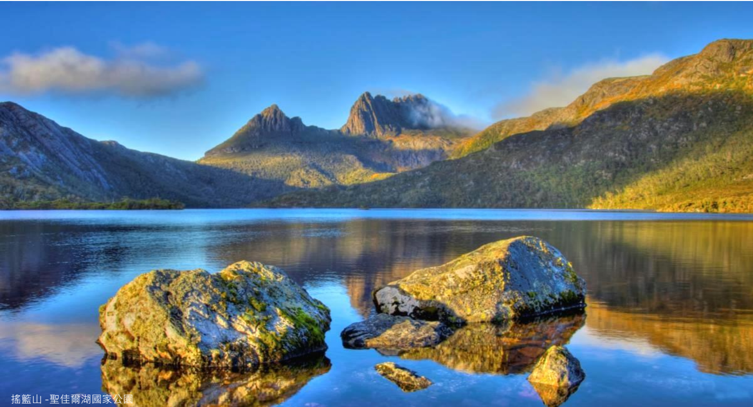
搖籃山 - 聖佳爾湖國家公園

7日5夜 [出發日期: 至2020年4月30日] | 7 Days 5 Nights [Travel Period: Till 30Apr20]