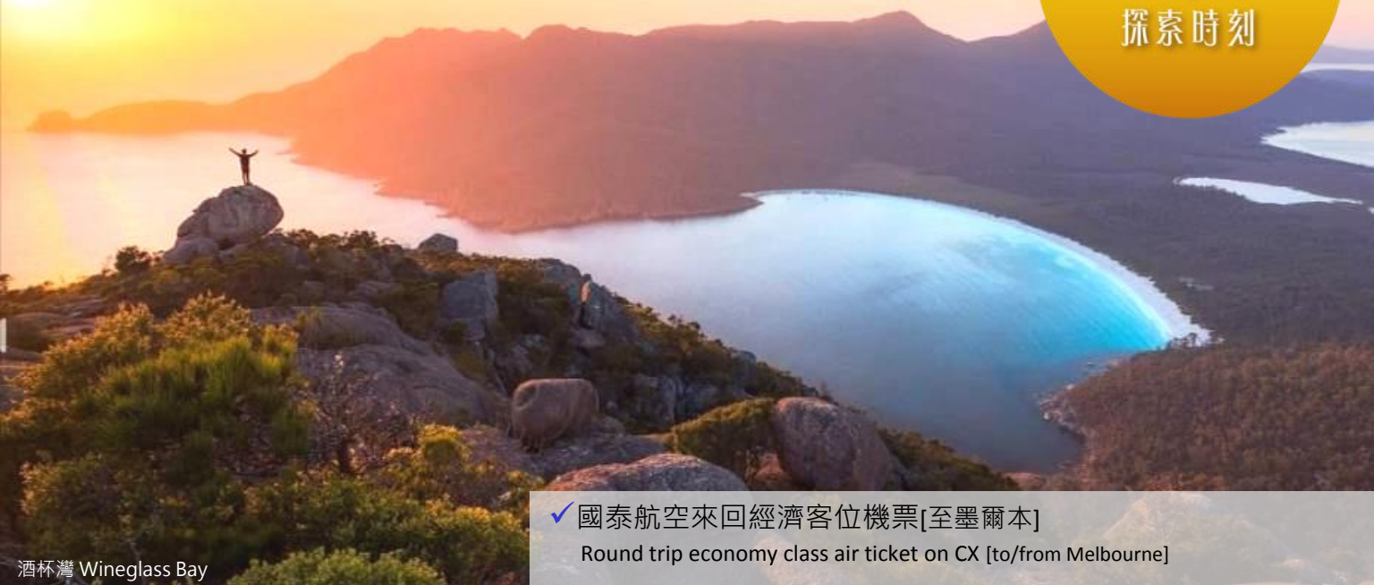
酒杯灣 Wineglass Bay